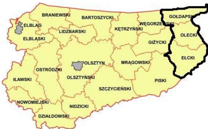
Mapa 1. Obszar LGD „Lider w EGO” na tle woj. warmińsko-mazurskiego

Obszar LGD „Lider w EGO” jest spójny przestrzennie, gminy tworzą zwartą, spójną strukturę o jasno określonych granicach, co przedstawiają poniższe mapy: