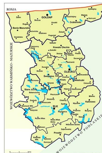
Mapa 2. Obszar LGD „Lider w EGO”